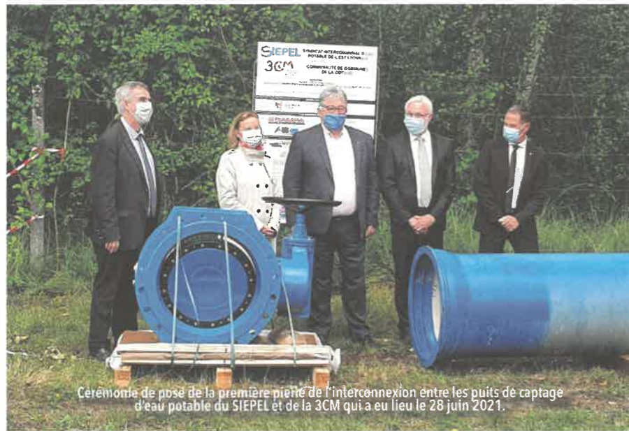
Ceremonie de pose de la première pierre de l'interconnexion entre les puits de captage d'eau potable du SIEPEL et de la 3CM qui a eu lieu le 28 juin 2021.